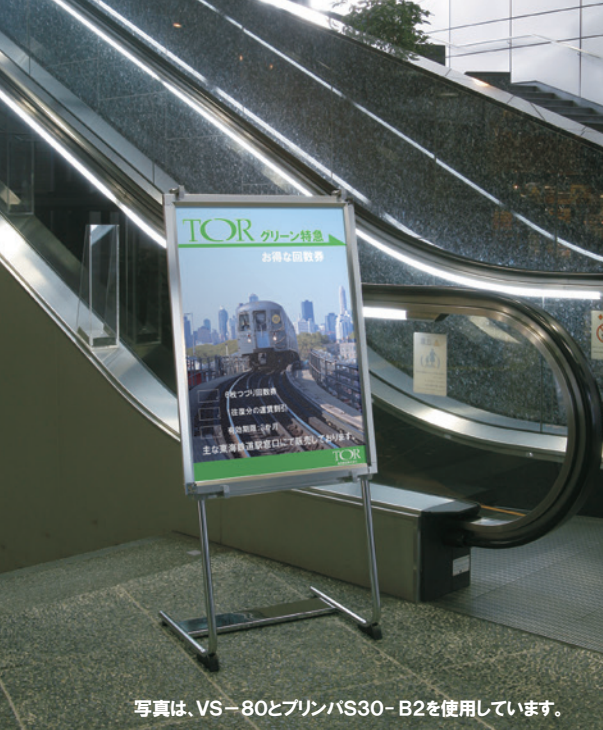
写真は、VS-80とプリンバS30-B2を使用しています。