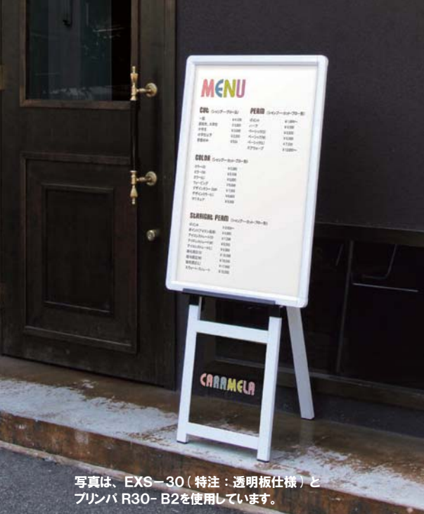
写真は、EXS-30（特注：透明板仕様）とプリンバ R30-B2を使用しています。