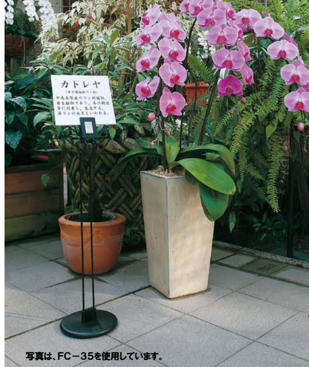
写真は、FC-35を使用しています。