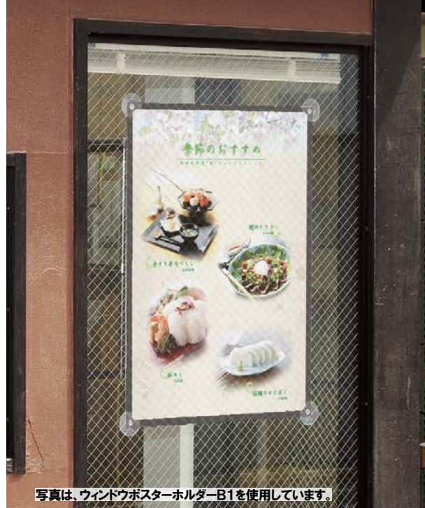
写真は、ウィンドウポスターホルダーB1を使用しています。