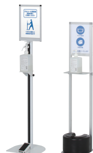
消毒液スタンド各種