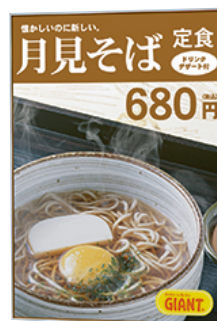
P.107掲載 オストレッチ