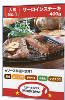
P.105掲載 フロントイレパネ