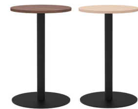
(ウォルナット) (ナチュラル)