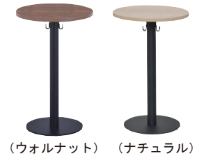
(ウォルナット) (ナチュラル)