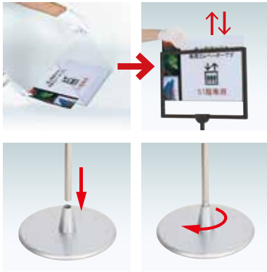
印刷物のはさみ方