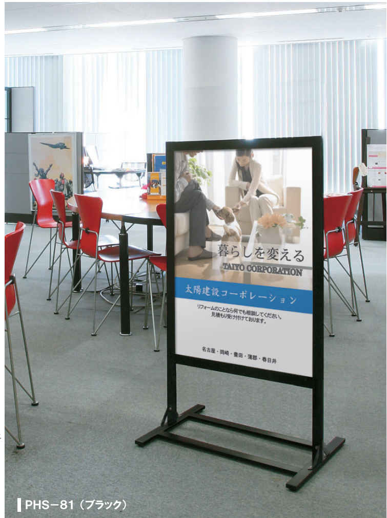
■ PHS-81 (ブラック)

本体 ■ アルミ押型材 コーナー ■ ABS 樹脂 面板 ■ アートパネル白 3mm