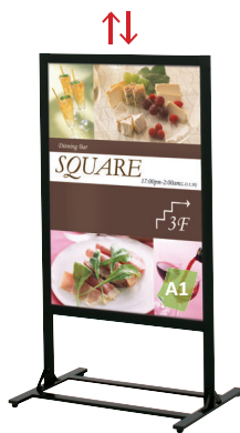
PHS-81 (ホワイト/ブラック)

面板サイズ ■ A1 (W594 × H841mm) アジャスター仕様 ※ご注文時にカラーをご指定ください。