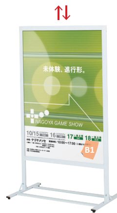
PHS-85 (ホワイト/ブラック)

面板サイズ ■ B1 (W728 × H1030 mm) アジャスター仕様 ※ご注文時にカラーをご指定ください。