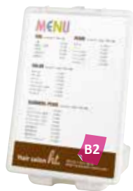
PG32R-B2との組み合わせ例

パネルサイズ ■ 厚み 25mm まで 幅 400 ~ 800mm まで 高さ 700 ~ 1100mm まで ※パネルは含まれておりません。