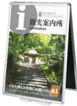
PG32R-B1との組み合わせ例

パネルサイズ ■ 厚み 25mm まで 幅 400 ~ 800mm まで 高さ 700 ~ 1100mm まで ※パネルは含まれておりません。