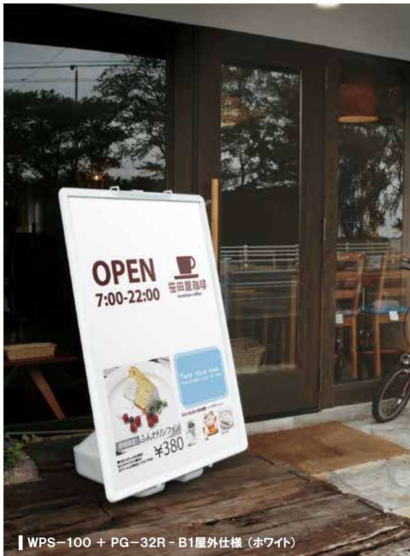
WPS-100 + PG-32R - B1屋外仕様 (ホワイト)