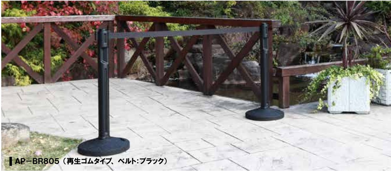
AP-BR805 (再生ゴムタイプ、ベルト:ブラック)