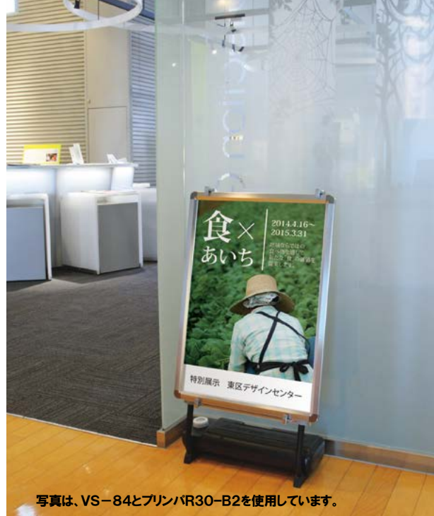
写真は、VS-84とプリンバR30-B2を使用しています。