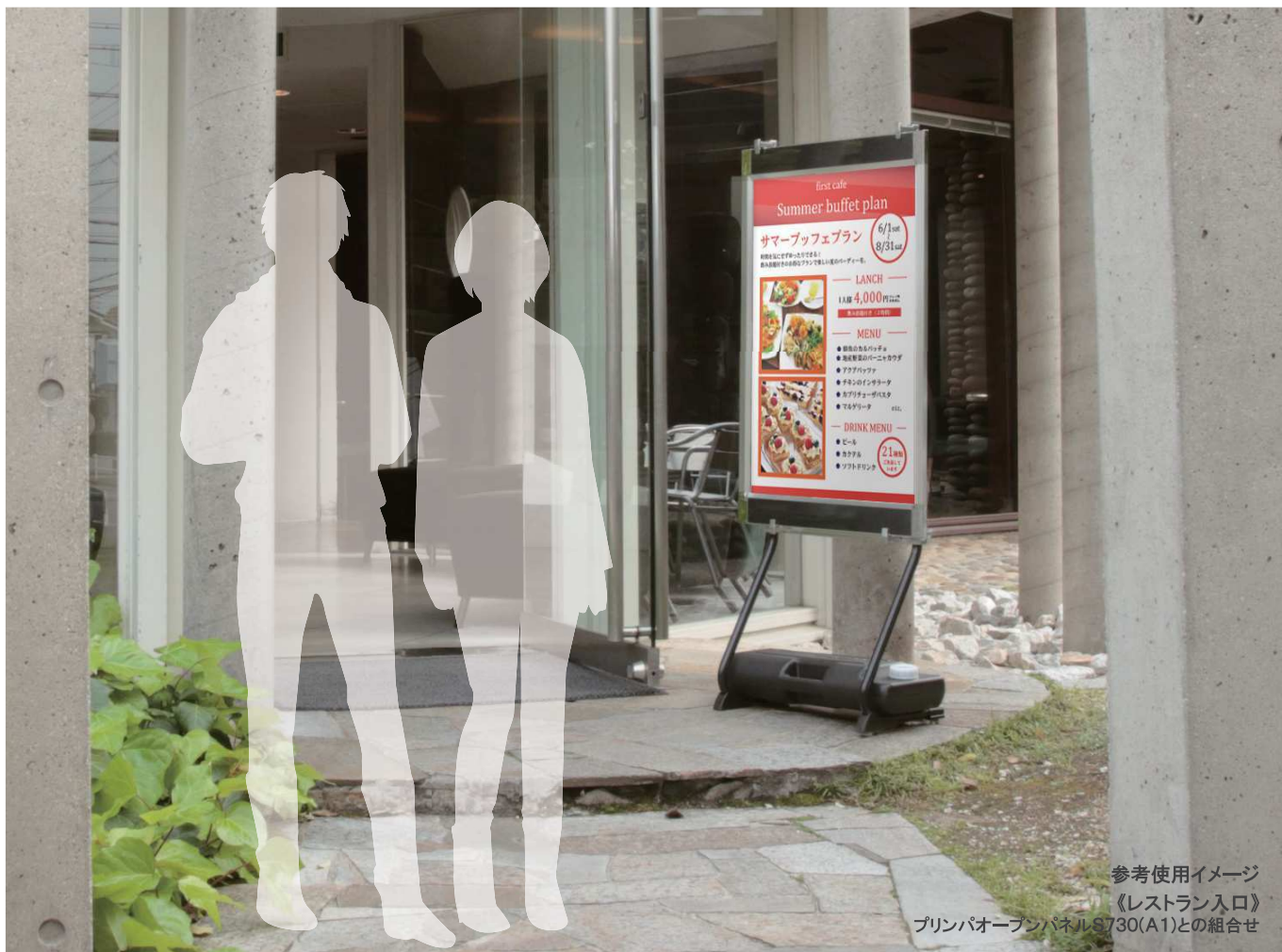
参考使用イメージ 《レストラン入口》 プリンパオープンパネルS730(A1)との組合せ