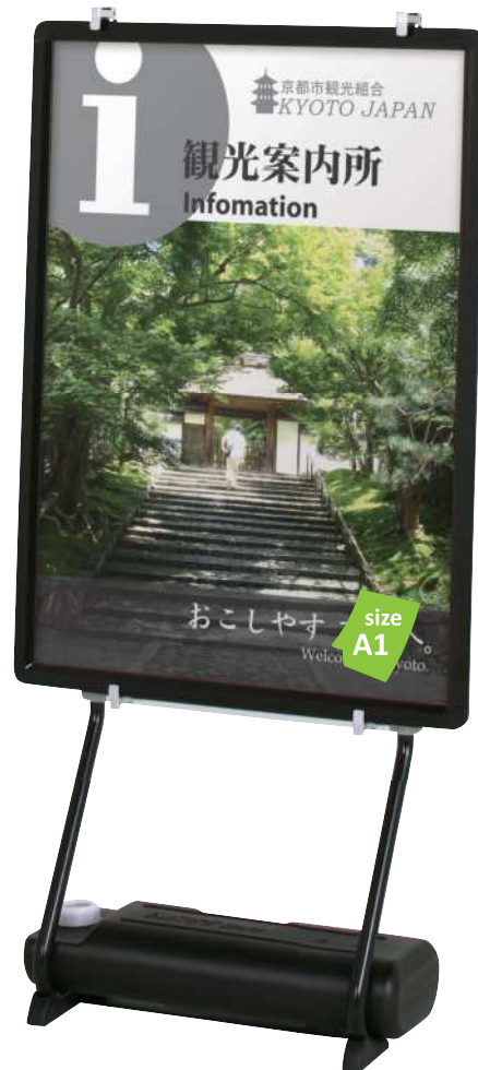
プリンパオープンパネルR30(A1)との組合せ例