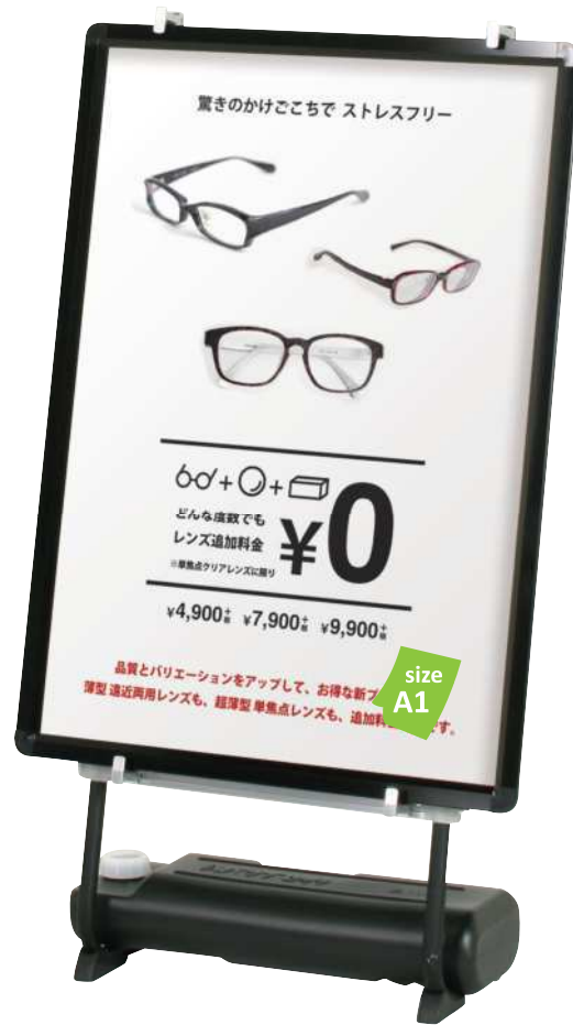
プリンパオープンパネルR30(A1)との組合せ例