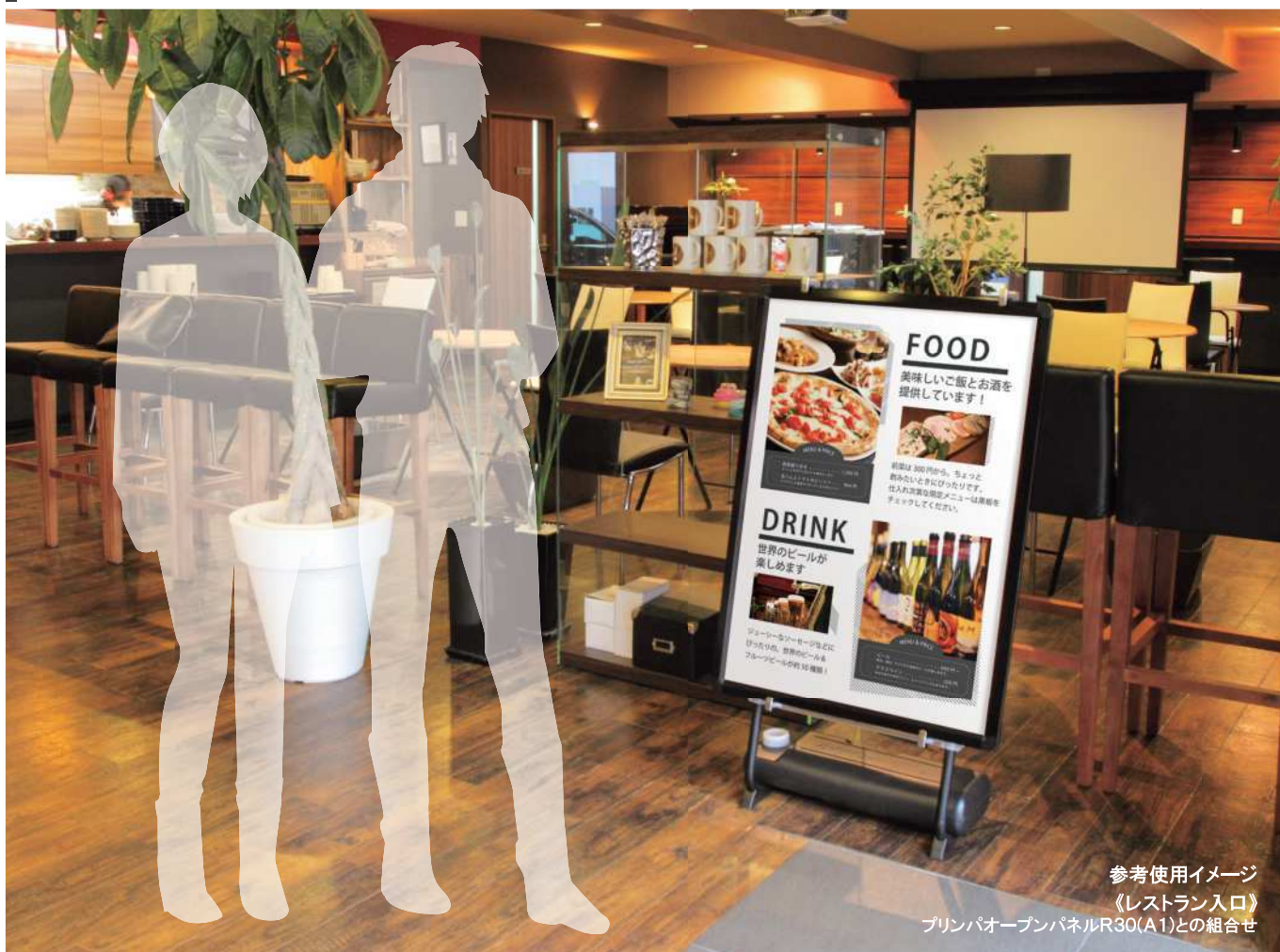
参考使用イメージ 《レストラン入口》 プリンパオープンパネルR30(A1)との組合せ