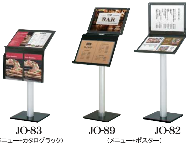
JO-83 (メニュー+カタログラック)

※総合カタログNo.08 P.268-P.269掲載 (このカタログには掲載されていません)