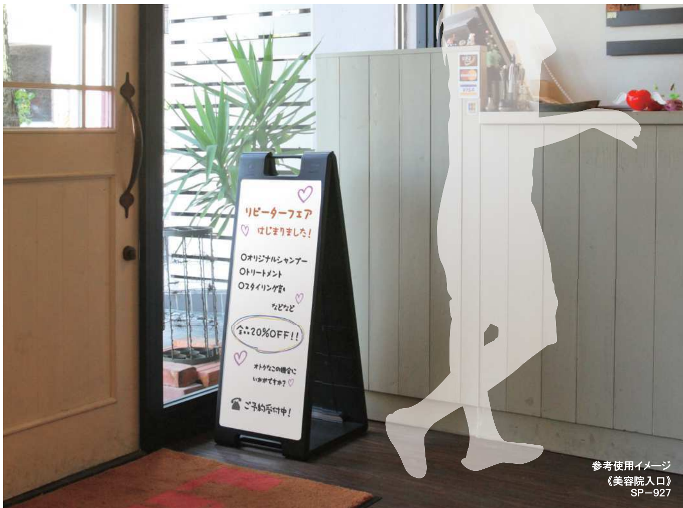
参考使用イメージ 《美容院入口》 SP-927