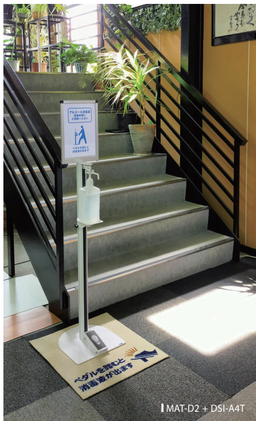
↑ MAT-D2 + DSI-A4T