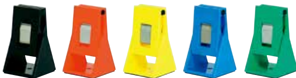
①ブラック ②レッド ③イエロー ④ブルー ⑤グリーン