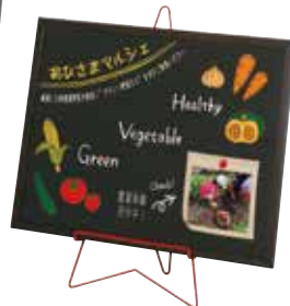
FE-11R(レッド) + ブラックボード横置き