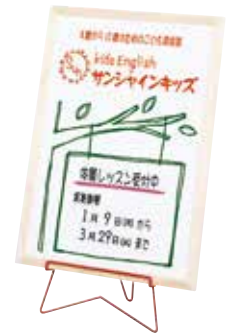
FE-11R(レッド) + ホワイトボード縦置き