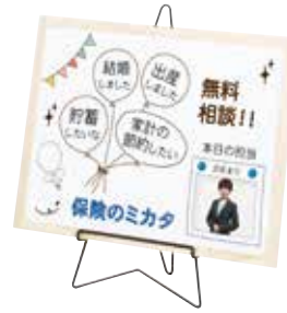
FE-11B(ブラック) + ホワイトボード横置き