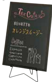
FE-11B(ブラック) + ブラックボード縦置き