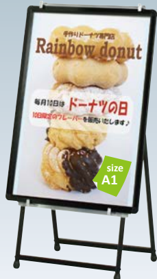
プリンバ R30-A1 との組み合わせ例

重量 ■ 3.5kg 本体 ■ スチール黒塗装仕上 上部柱 ■ アルミ押型材アルマイト仕上 パネルサイズ ■ 厚み 30mm まで 幅 550 ~ 900mm まで対応 ※パネルは含まれておりません。