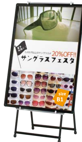
プリンバ R30-B1 との組み合わせ例