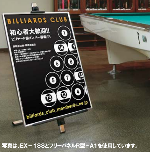
写真は、EX-188とフリーパネルR型-A1を使用しています。