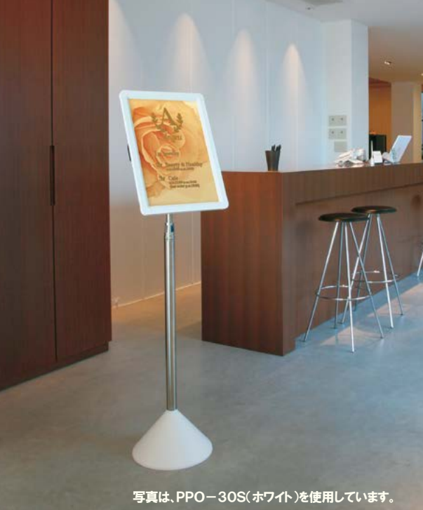
写真は、PPO-30S(ホワイト)を使用しています。