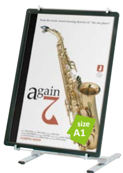
プリンパ R30-A1 との組み合わせ例 PS-110 P.125 参考 ¥47,800 (税抜価格)