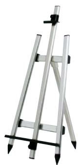
EX-199 P.138 参考 ¥26,600 (税抜価格)