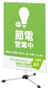
スリムエイト-A1との組み合わせ例 PS-88 P.127 参考 ¥9,500 (税抜価格)