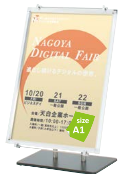
プリンパ S30-A1 との組み合わせ例 PS-119 P.125 参考 ¥49,800 (税抜価格)