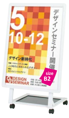
片面パネル (屋外用 R30-B2) 付き AL-82 P.169 参考 ¥46,000 (税抜価格)