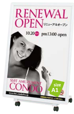
片面パネル (屋外用 R30-A1) 付き AL-81 P.169 参考 ¥50,000 (税抜価格)