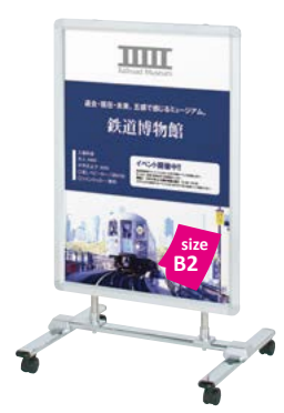
片面パネル (R30-B2) 付き VS-82 P.152 参考 ¥37,500 (税抜価格)