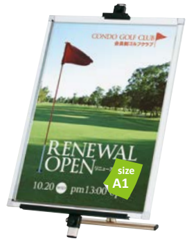
プリンパ S30-A1 との組み合わせ例 EX-188 P.137 参考 ¥18,800 (税抜価格)