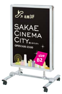
両面パネル (R30-B2) 付き VS-82W P.152 参考 ¥50,000 (税抜価格)