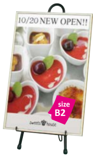
ツートンパネル-B2との組み合わせ例 YA-11 P.146 参考 ¥10,000 (税抜価格)