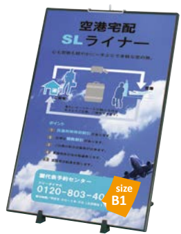
フリーパネルR型-B1との組み合わせ例 PS-100 P.125 参考 ¥16,000 (税抜価格)