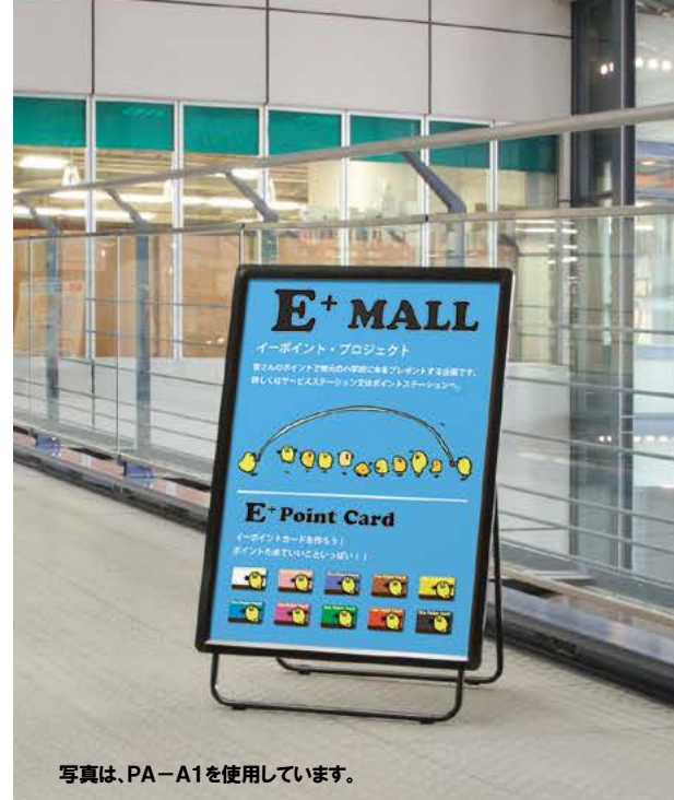
写真は、PA-A1を使用しています。