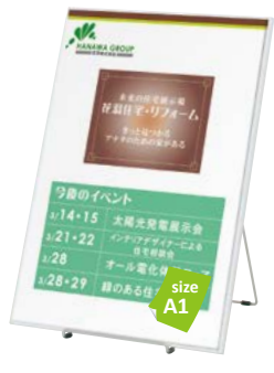
スリムエイト-A1 との組み合わせ例 YA-21 P.146 参考 ¥6,800 (税抜価格)