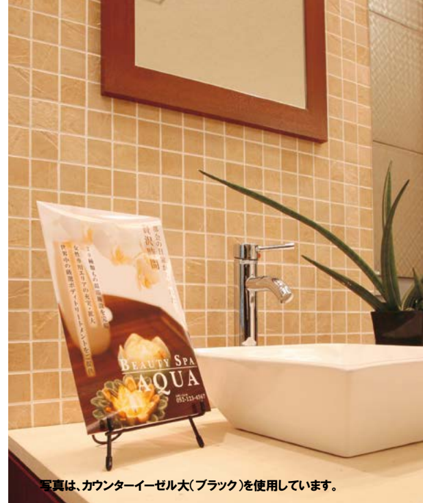
写真は、カウンターイーゼル大(ブラック)を使用しています。